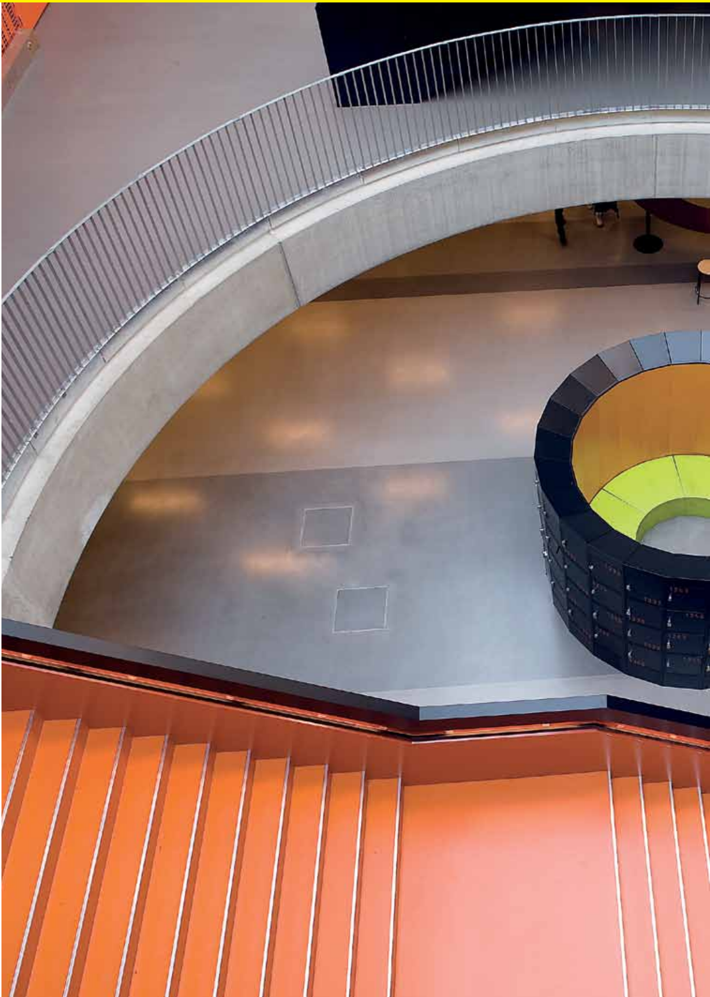
Thor Heyerdahl Schule, Norwegen