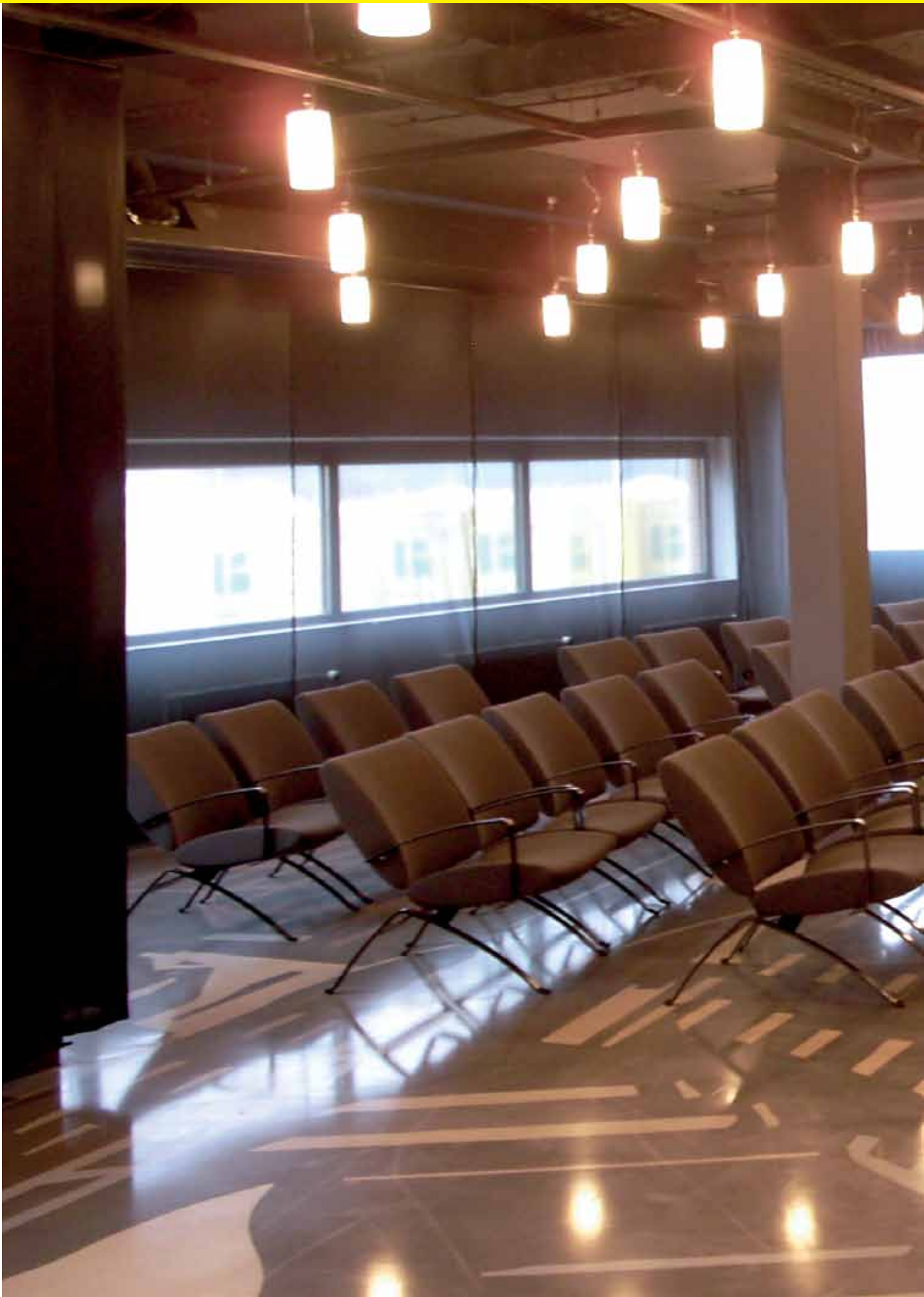
Veranstaltungsraum Saint-Gobain Weber, Niederlande