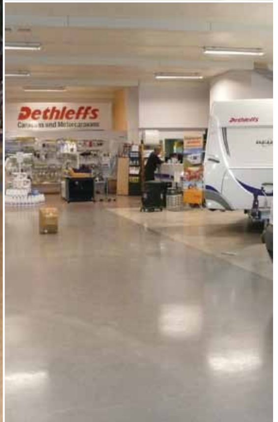
Großes Bild: Hugo Boss, Hongkong. Oben rechts: Olymp & Hades, Essen. Unten rechts: Akershus Caravan Center, Norwegen.