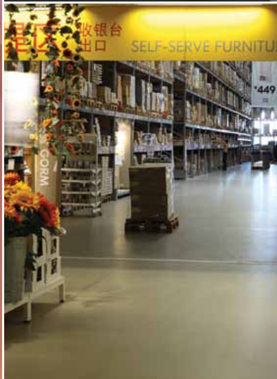
Großes Bild: Anne-Frank-Museum, Berlin. Oben rechts: Büroräume, Köln. Unten rechts: Ikea, Shenzhen, China