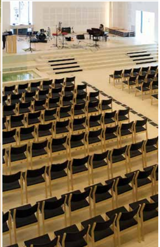
Orstad Kirche, Norwegen