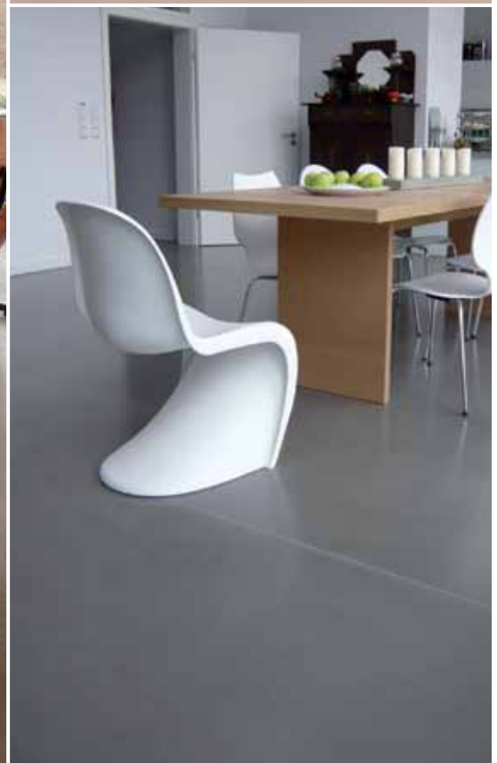
Großes Bild: Privathaus, Großbritannien. Oben rechts: Einrichtungshaus, Deutschland. Unten rechts: Privathaus, Deutschland.