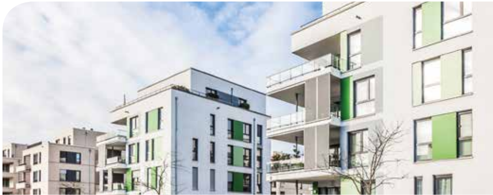
Wert der gewonnenen Fläche*

Begehrter Schrank? Abstellfläche? weber.therm plus ultra schafft Raum